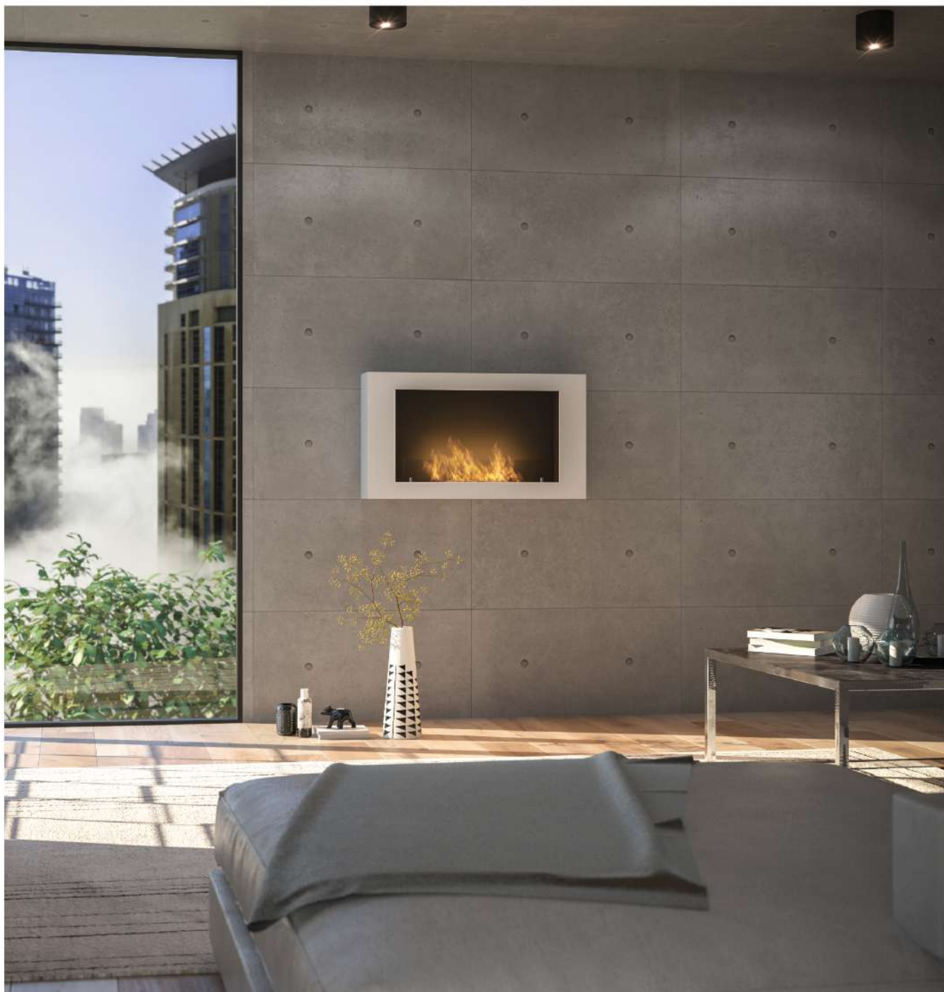
Biokominek Murall 1000