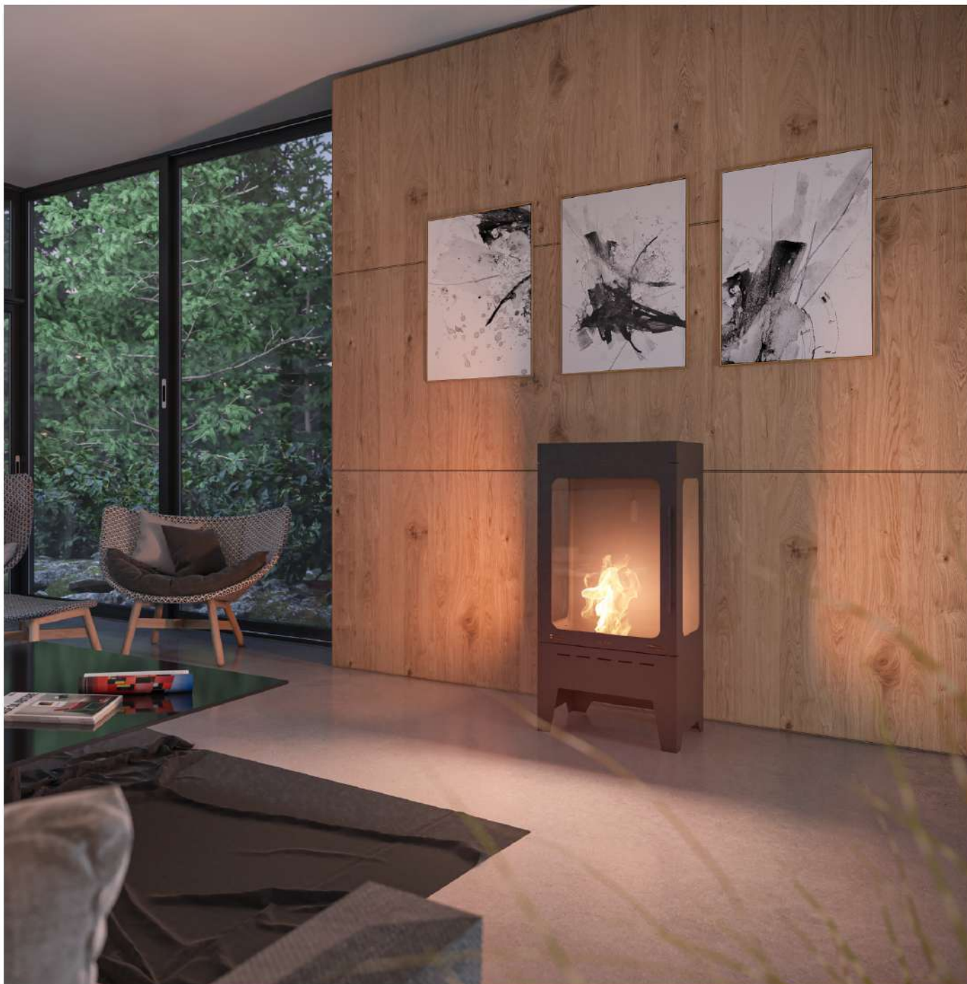
Biokominek Incoza 3