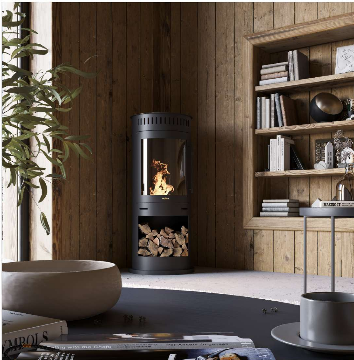
Biokominek Incoza 4