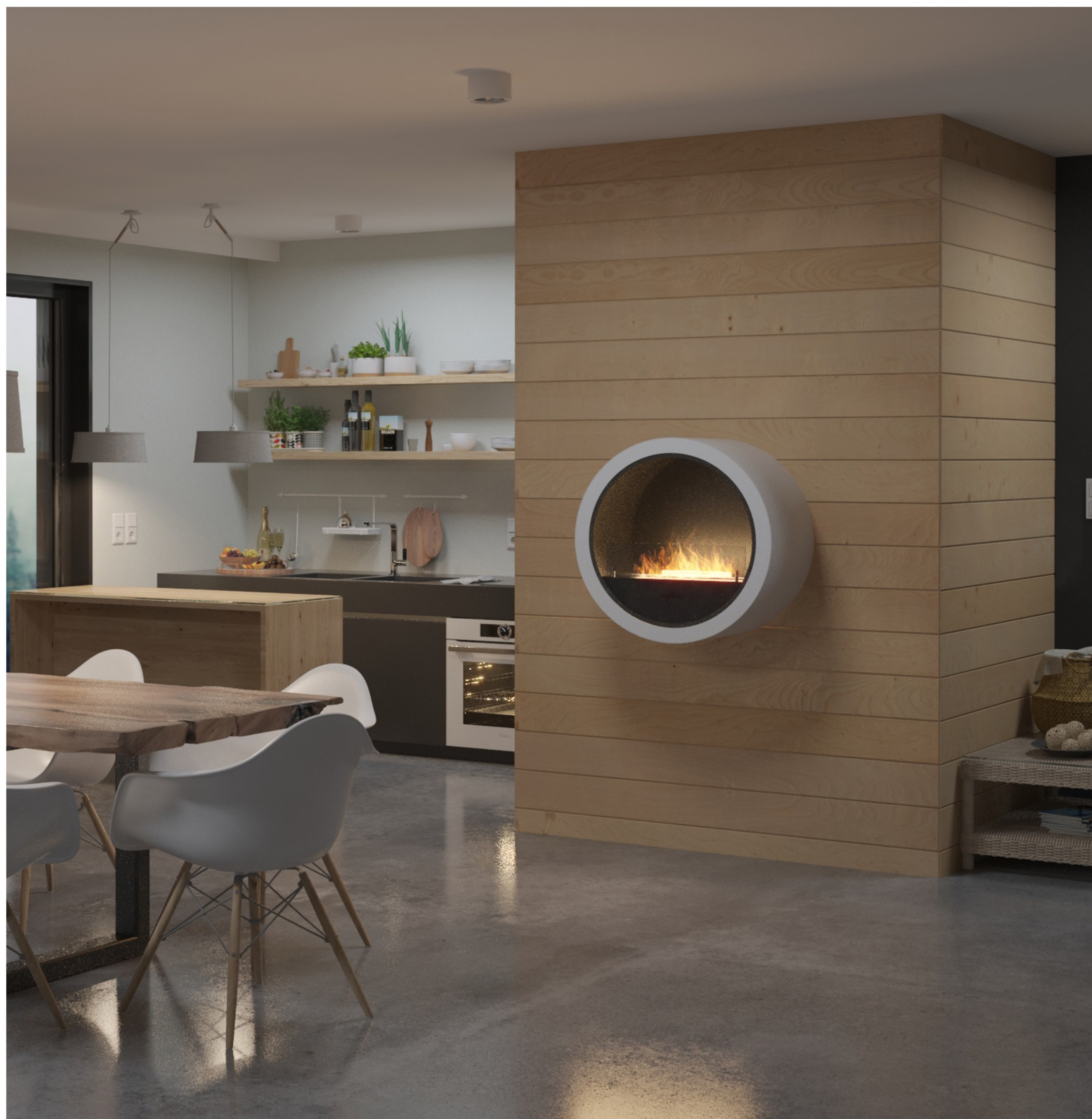
Biokominek Incyrcle Wall